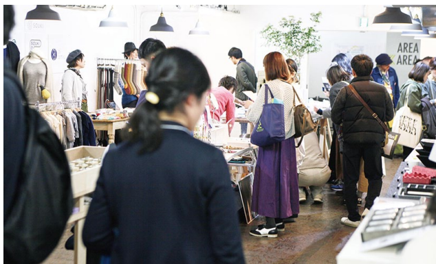
EXTRA PREVIEW #18 会場風景