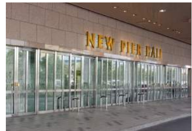
会場写真 (ニューピアホール)