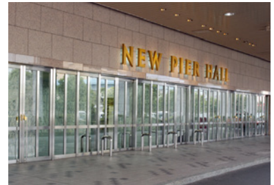
会場写真（ニューピアホール）