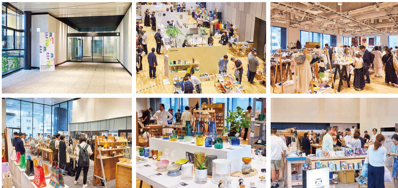
EXTRA PREVIEW #27 KANDA SQUARE会場風景