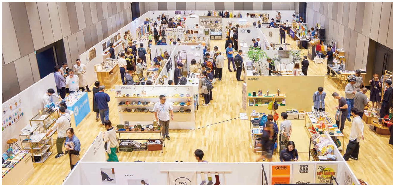
EXTRA PREVIEW #27 KANDA SQUARE会場風景